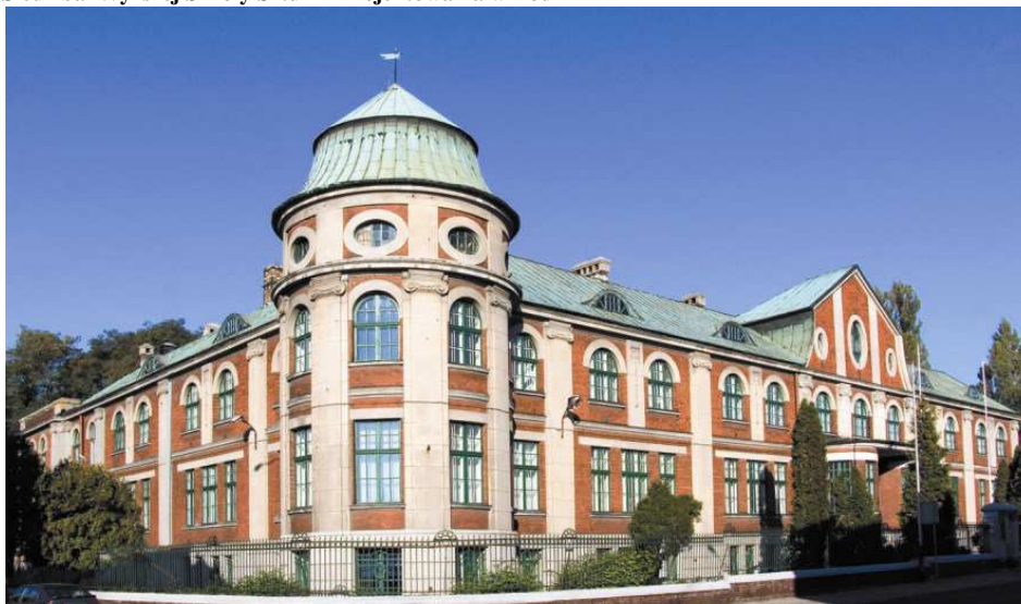
Siedziba Wyższej Szkoły Sztuki i Projektowania w Łodzi

Jedyna niepubliczna szkoła filmowa, fotograficzna , projektowa i kulturoznawcza w regionie łódzkim, a także w Polsce, o randze uczelni artystycznej. Uczelnia kształci – poza studiami licencjackimi i magisterskimi również na studiach podyplomowych niestacjonarnych na wszystkich prowadzonych kierunkach i w specjalnościach wymienionych w tabeli 1. Studia podyplomowe adresowane są do absolwentów studiów I i II stopnia (licencjackich i magisterskich)